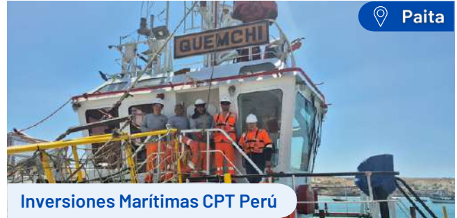
Inversiones Marítimas CPT Perú