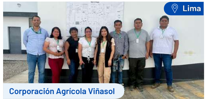
Corporación Agrícola Viñasol