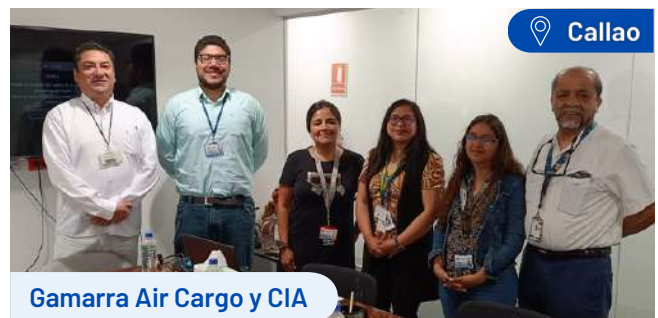
Gamarra Air Cargo y CIA