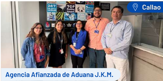
Agencia Afianzada de Aduana J.K.M.