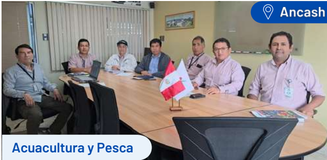
Acuicultura y Pesca